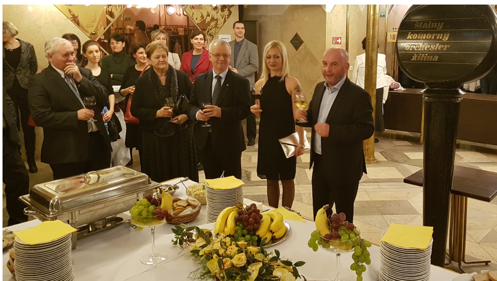
Účastníci fašiangového koncertu v Žiline